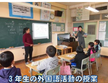
3年生の外国語活動の授業

平成最後の年となった今年度は、次の二つのことが実施されました。① 外国語活動（英語）が3年生から必修 になりました。中学年から「聞く・話す（やりとり・発表）」ことを中心に、英語に慣れ親しみ、高学年では「読む・書く」も含めて英語を習得しました。そのため3年生以上は授業時間が増え、本校では、今年度は月2回ほど、水曜日を6時間授業にして年間15時間増やしましたが、来年度は毎週6時間授業となって、35時間を増やすこととなります。